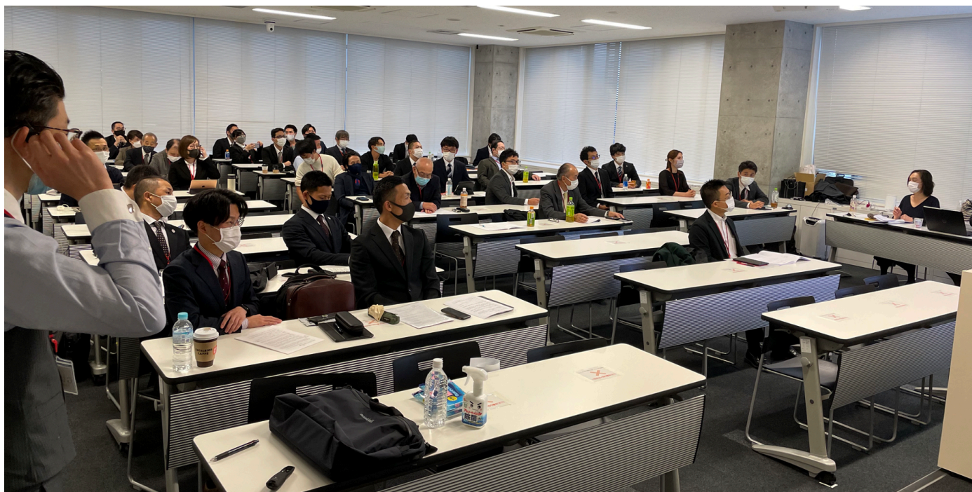
東京カレッジオブカイロプラクティックの24期生、25期生の卒業研究発表